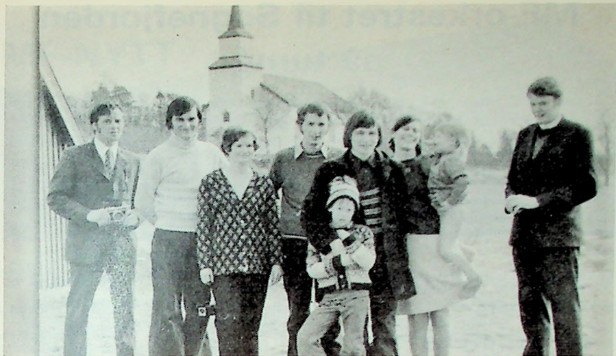
Foran Kolvereid kirke