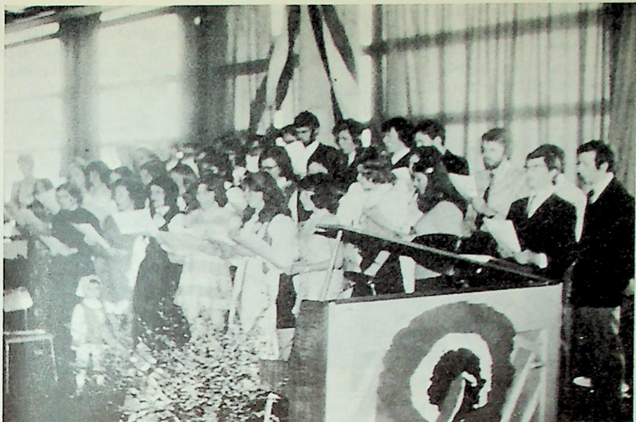
MF-koret i aksjon på MF's 17. mai fest.