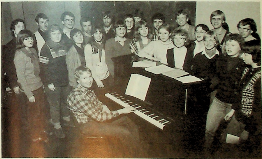
MF-koret samlet til øvelse i auditorium 1.

Reint miljømessig gjer det særskilt mykje for koret med slike turar. Det gjer at vi vert betre kjende med kvarandre, samstundes kjem vi som nemnt ut til kyrkjelydane og vert