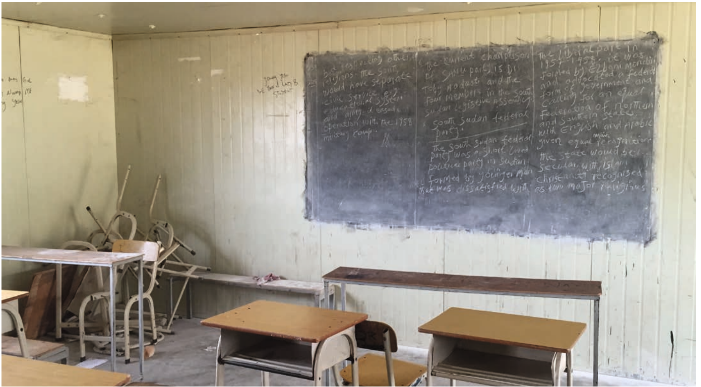
Klasserom i Sør-Sudan