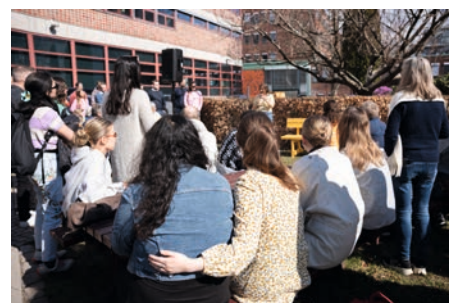
Studenter og ansatte samlet seg til markering og åpning av minnebenken.