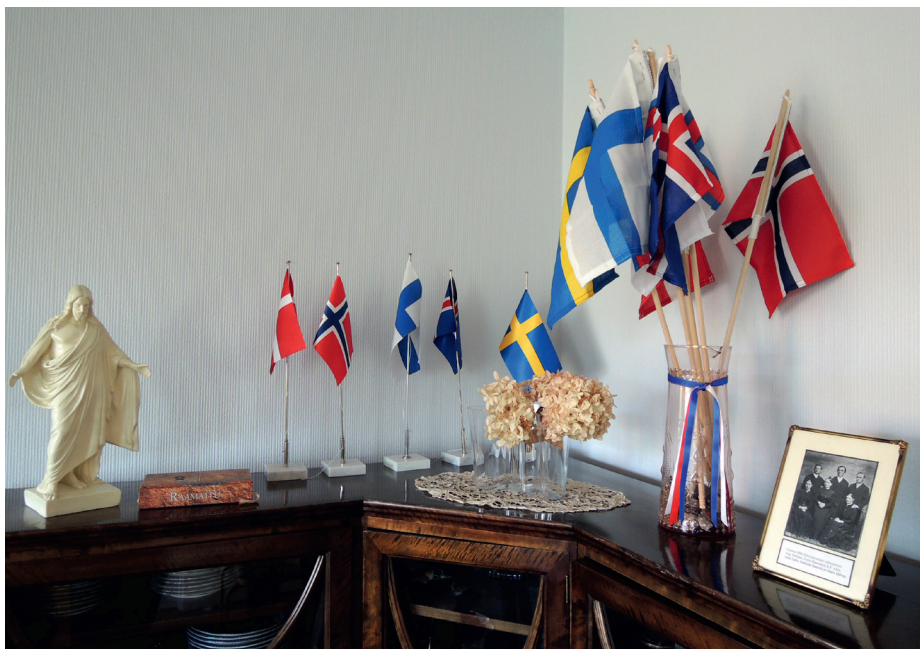
Fra OLLs hovedkvarter: Flagg symboliserer båndet mellom OLL og de nordiske søsterorganisasjonene. Tilsvarende finnes også flagg fra de land der OLL-støttede misjonærer arbeider. OLL-medlemmer i Tampere-området samles regelmessig i hovedkvarter til bønnemøter og andre aktiviteter.

Så snart den nordiske forbindelsen var knyttet, kom flere skandinaviske gjester på besøk og deltok særlig ved lærernes sommermøter i Päiväkumpu (FMS' utdannings-senter), som startet opp i 1957 og hvert år telte omkring 100 deltakere, menn så vel som kvinner. 54 Tilsvarende sendte OLL representanter til de skandinaviske søsterorganisasjonenes sommermøter. 55