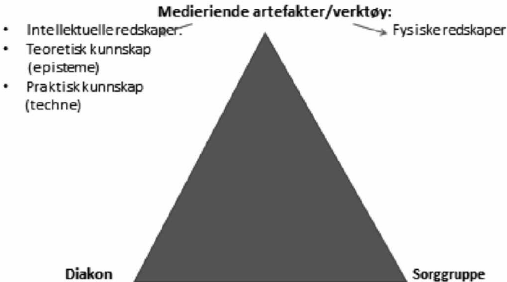
Figur 2 viser diakonen som aktør, medierende artefakter og sorggruppen (mål)

I sorgsamtaler medierer diakoner sin profesjonskunnskap "som er spesialisert kunnskap som skiller seg fra livsverdenens allmennkunnskap", jfr. profesjonsdefinisjon, og anvender denne for å identifisere, resonnere og bestemme handlingsmåte. Dette må brukes i kombinasjon med skjønn, fordi "problem-situasjonene vanskelig lar seg standardisere". Hvordan diakonen medierer sin kunnskap, er