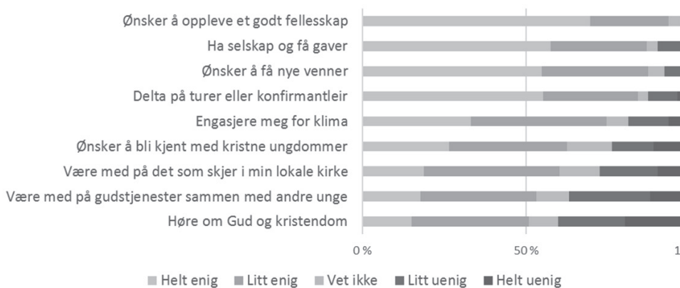
Fig. 2: Spørsmålet «Hva gleder du deg til eller synes er viktige å være med på i tiden før konfirmasjonen?» er sortert etter synkende gjennomsnittsverdi.

Et mål med undersøkelsen er å få fornyet innsikt i hva slags innhold 14-åringer tillegger konfirmasjonstiden. En hensikt var å kunne forbedre kirkens kommunikasjon om konfirmasjon, derfor ble bare de som svarte at de planla kirkelig konfirmasjon (Tab. 1, n=181 ) stilt spørsmålet «Hva gleder du deg til eller synes er viktig å være med på i tiden før konfirmasjonen?». 5 Sosiale aspekter ved konfirmasjonstiden står som det viktigste av det ungdommene ser frem til (Fig. 2).