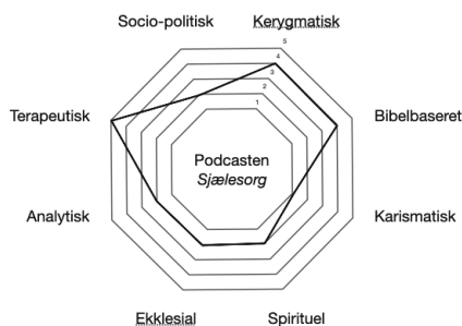
Figur 3. I hvor høj forefindes typen i podcasten Sjælesorg?

Endelig vil jeg formidle den idé, at cirkelmodellen kan benyttes til selv-refleksion i forbindelse med undervisningen i praktisk sjælesorg, f.eks. på pastoralseminariet. 26 Man kan indtegne sin selvforståelse som sjælesørger og derefter analysere nogle af sine samtaler. Måske forstår man selv som karismatisk, men agerer socio-politisk? Hvis der er diskrepans, kan man arbejde med at bringe selvforståelse og praksis i vater, enten ved at justere sin selvforståelse eller justere sin praksis.